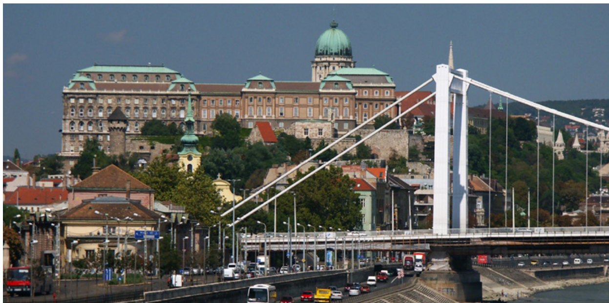
Kép: Jan Cernoch

a februárban megrendezett 2016-os Tajpei Nemzetközi Könyvvásár díszvendége, bemutatva a magyar kultúra számos aspektusát a tajvani emberek számára. Ezt követően került megrendezésre egy tudományos konferencia Budapesten a Budapesti Gazdasági Egyetem szervezésében február közepén, összehozva 10 tajvani és 15 magyar tudóst. Tavaly pedig sor került a tajvani Nemzeti Központi Könyvtár és a magyar Nemzeti Széchenyi Könyvtár közötti egyet-