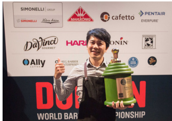
World Barista Championship Facebook

jó minőségű víz, hiszen ez adja a kávé 98 százalékát”, mondja Wu. Megfelelő a víz, ha a pH értéke, teljes oldott sótartalma (TDS) ideális szinten van, valamint ásványi tartalma alacsony (puha víz), vagy magas (kemény víz).