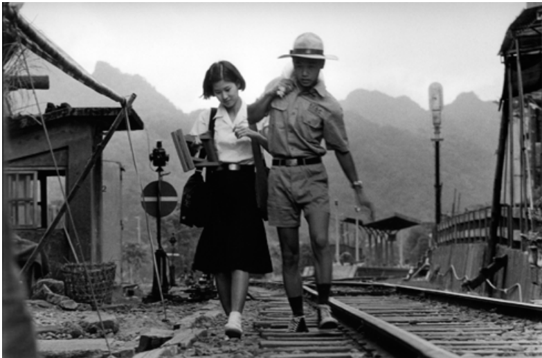
Jelenet Hou 1986-os "Por a szélben" című filmjéből

Bár jelentős dicsőretet kaptak helyi és nemzetközi kritikusoktól, a