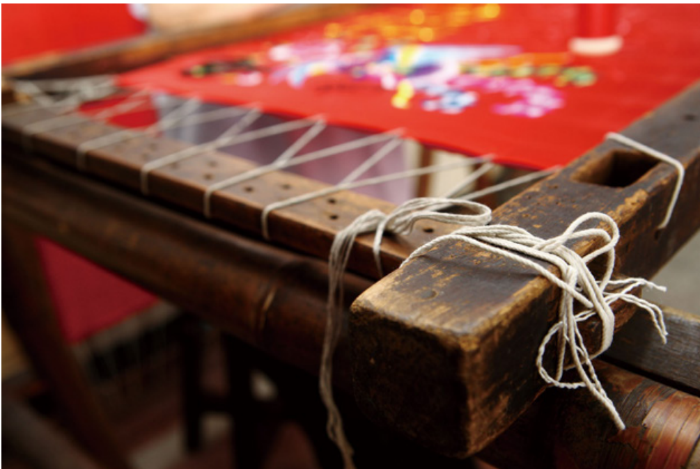
A cég viharvert hímzőkerete jól bírja még, bár a kézművesség fakulóban van.