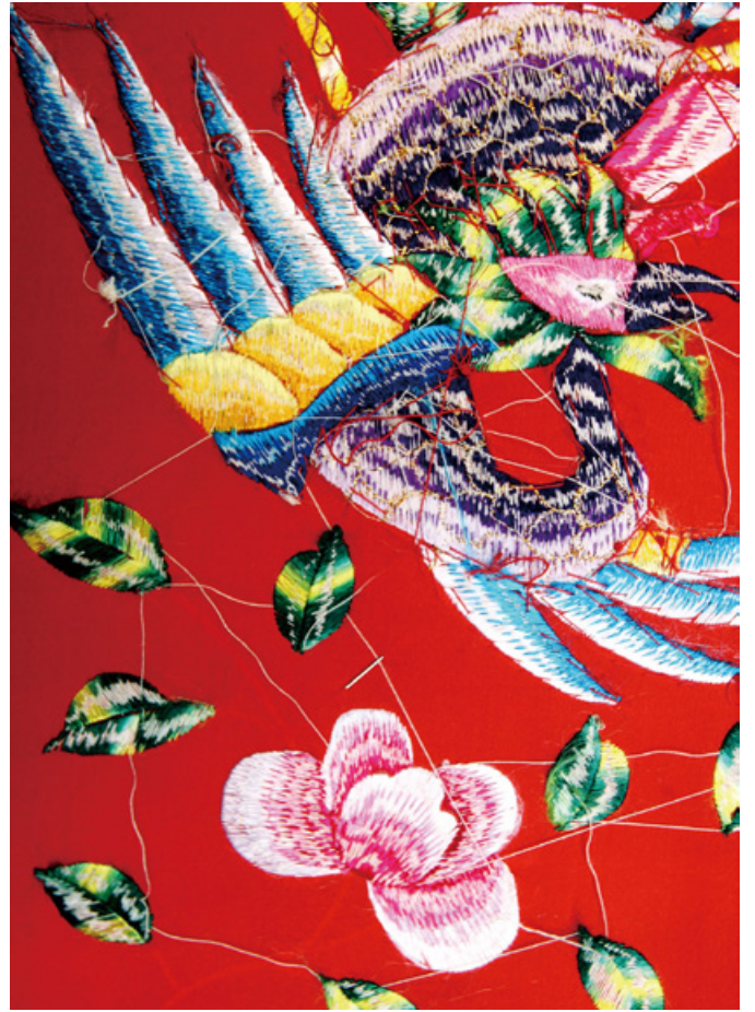
A kézi hímzéshez türelemre van szükség, hónapokba telhet egyetlen darab elkészítése.