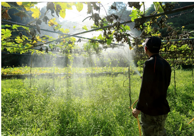
Egyre több fiatal fordul a mezőgazdaság felé, hogy megkeresse kenyerét. Jelenleg a szektor nagyjából negyede 15 és 44 év közötti.

Hogy visszafordítsák ezt a trendet, a központi és helyi kormányzatok kifejlesztettek egy programot, hogy visszacsábítsák a fiatalokat ehhez a hivatáshoz. A COA egyik