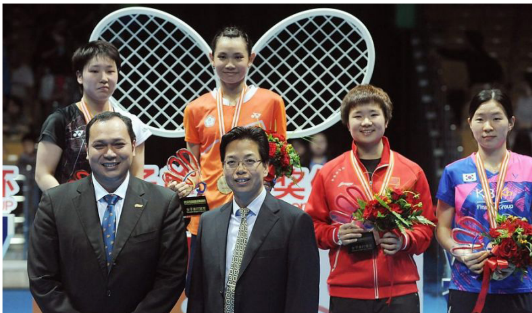
Forrás: Focus Taiwan, Kép: A Tollaslabda Világszövetség tulajdona