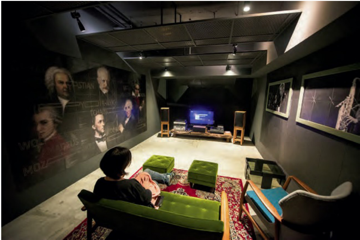
Válassz egy albumot és vedd be magad a stúdióba, ahol elmerülhetsz a bakelit mámorító taktusaiban.

adásait online darabonként több mint NT$ 20,000-ért kínálják. Ez elgondolkoztatta édesanyja szeretett kollekcijáról, a több ezer albumról a családi dohánypajtában. Rávette hát nagypját, hogy adja neki a több mint 80 éves épületet és teljesen felújította, ötvözve bakelit lemezek mérhetetlenül különböző elemeit a hagyományos tajvani építészettel, hogy Mainong új látványosságát hozza létre.