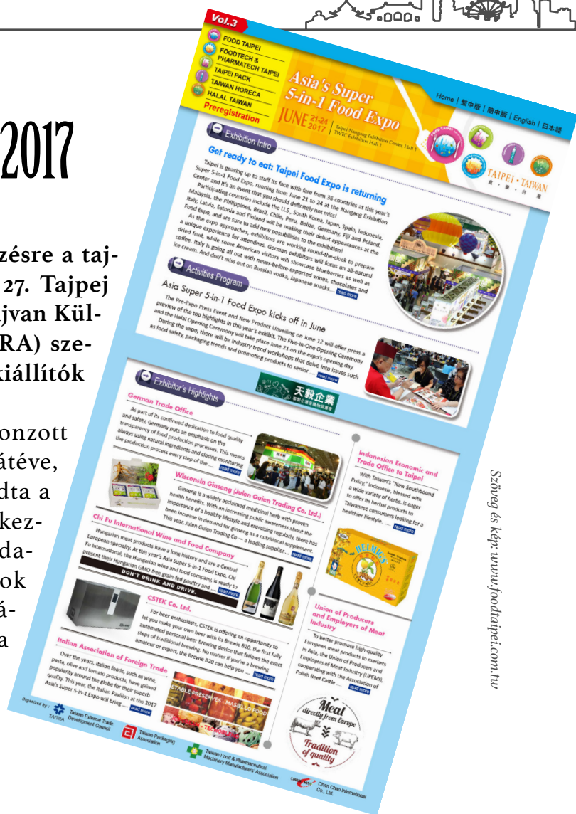
Szöveg és kép: www.foodtaipei.com.tw

Tavaly az esemény 1,100 kiállítót vonzott 2,148 standdal, mondta a TAITRA, hozzátéve, hogy a látogatók száma pedig meghaladta a 67,000-t, melyben több mint 7,700-en érkeztek a tengerentúlról. Az esemény weboldala szerint magyar hústermékek és borok is kiállításra kerülnek. További információért a belépőjegyekről látogasson el a Food Taipei honlapjára.