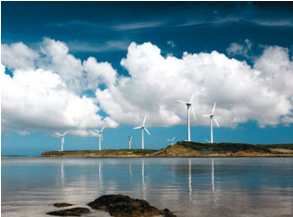
Egy szélenergia telep, melyet a Taipower épített Penghu szigetének Baisha községében.

Jelenleg a fosszilis üzemanyagokkal működő energia állomások a nemzet energiájának nagyjából 80 százalékát termelik ki. A Tajvant alacsony szénkibocsátású társadalommá való átalakítására irányuló törekvések részeként a kormányzat célja a szén égetésével előállított elektromosság arányának a jelenlegi 37,7 százalékról 30 százalékra való csökkentése 2025-ig. A földgáz használatával előállított energia arányát pedig 35,1 százalékról 50 százalékra emelnék ezen idő alatt, az olajt égető telepeket pedig teljesen megszüntetnék. A maradék 20 százalékot pedig biomassza, víz-, nap- és szélenergia források biztosítanák, amik jelenleg a nemzeti ellátás nagyjából 4 százalékát adják, valamint új megújuló energiaforrások, mint a geotermál energia.