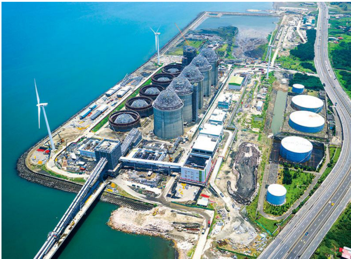
New Taipei City Linkou Erőművében megkezdte működését Tajvan első ultra-szuperkritikus szénégetésű generátora 2016 októberében.

Tajvan energiagenerátor szektora egy kiegyensúlyozottabb jövő felé halad az ország szintű újjáépítő kezdeményezéseknek köszönhetően.