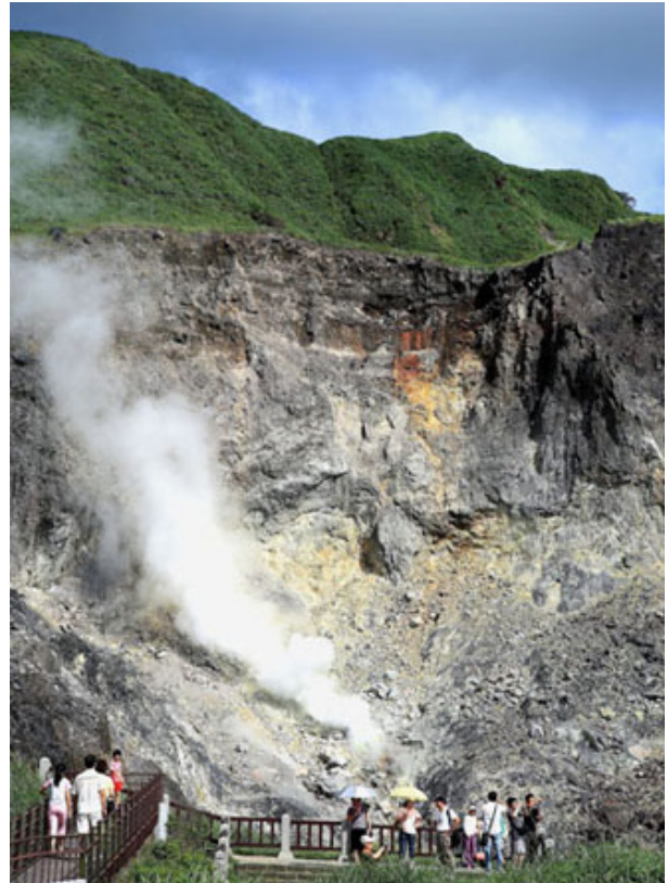
Datun-hegy, a Yangmingshan Nemzeti Park szívében Tajpei és New Taipei City határán, geo termál forrásokkal rendelkezik, melyeket elektromosság előállítására használhatnak.