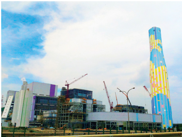
New Taipei City Linkou Erőműve

Évtizedekig a Taipower uralta a belföldi elektromos szektort, döntéshozatali kontrollt gyakorolva a termelés, átvitel és elosztás felett. Az Elektromossági Törvény változtatása, amit januárban fogadott el a törvényhozás, a cél monopóliumának megszüntetését célozza, hogy kiépítse az utat számos más szolgáltató, az átviteli hálózatok fair használata és a fogyasztók szabad választása számára. A felvetett változtatások engedélyezik a megújuló energiavállalkozások számára, hogy termeljenek, eladjanak és küldjenek elektromosságok klienseik számára, a zöld energiafejlesztés számára is kifizetődő kör-