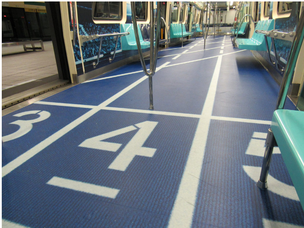
Szöveg: Taiwan Today, Kép: Taipei 2017 Universiade facebook

Összesen 71 információs állomást állítanak fel Tajpej-szerte a közelgő nyári Universiade-ra készülve, mely a legnagyobb nemzetközi sportesemény, melyet valaha Tajvanon rendezte, jelentette be a városi önkormányzat július 9-én.