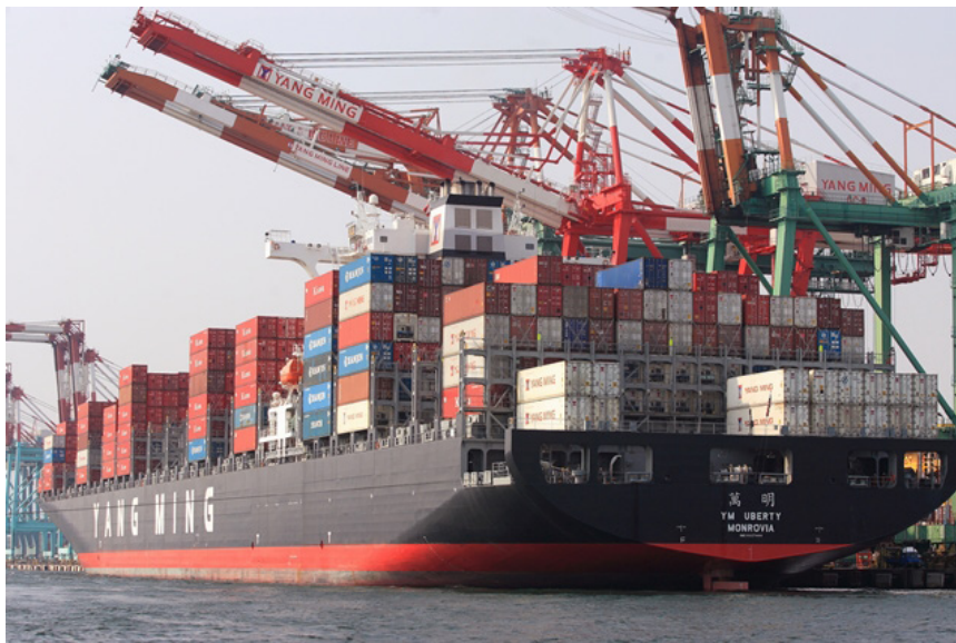
Szöveg: Focus Taiwan

Tajvan exportja visszatért a kétszámjegyű növekvéshez júniusban, főként az elektronikus készülékek és gépezetek iránti stabil globális keresletnek köszönhetően, árulta el a Pénzügyminisztérium (MOF) július 7-én.