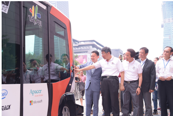
Ko Wen-je (Tajpei polgármestere) és az önjáró busz (Tajpei Önkormányzat tulajdona)

Augusztus 1. és 5. között kerül tesztelésre egy önjáró busz Tajpejben a helyi önkormányzat arra tett lépéseinek részeként, hogy a metropolisz okos-város fejlesztését felpörgessék, valamint tovább javítsák a lakosok életminőségét.