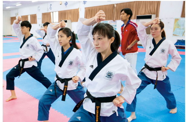
Tajvan taekwondo poomsae-je, a sportolók gyakorolnak a dél-tajvani Kaohsiung városában található Nemzeti Sportképző Központban.

olyan nagyvállalatok, mint a New Taipei központú, elektronikai termékeket gyártó Acer Inc., a Hsinchu központú vezető globális félvezető cég a MediaTek Inc., is nagy figyelmet fog kapni, mint az Universiade legfőbb szponzorai. Az Acer és a MediaTek együttműködik a tajpei EasyCard Corp.-pal, amely a tajvani tömegközlekedésben használt okos kártyá-