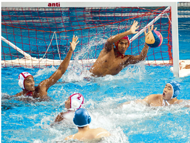
A tajpei Songshan Sportközpont a vízes számok házigazdája lesz a 2017. évi nyári Universiaden.

Tajvan kis- és középvállalkozásain felül az