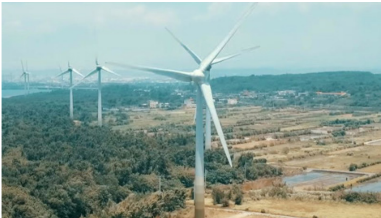
Szélérőművek is megjelennek a Külügyminisztérium által szeptember 1-jén megjelentetett rövidfilmben, melyek kiemelik az ország eltökéltségét a 2030-as FFC-k megvalósítására.