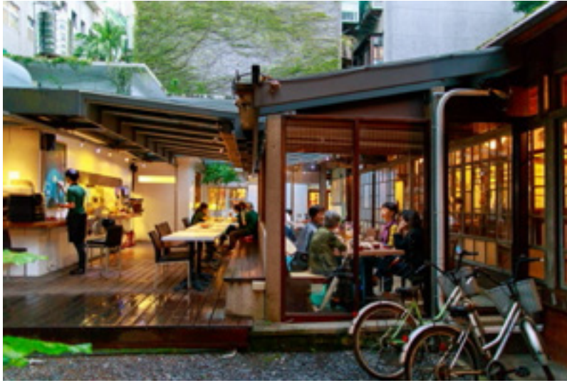
QingTian 76 – The Stories of the Past Brew a Sweet Melody