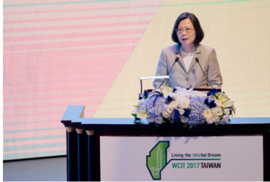
Tsai Ing-wen elnök asszony beszédet mond a 2017-es WCIT szeptember 11-i megnyitóján Tajpejben

A 39 éve Barcelonában elindított kongresszust 2016 óta minden évben megrendezik. Ez a legfontosabb esemény a WITSA számára, melynek tagjai a világ IT piacának 90 százalékát teszik ki.