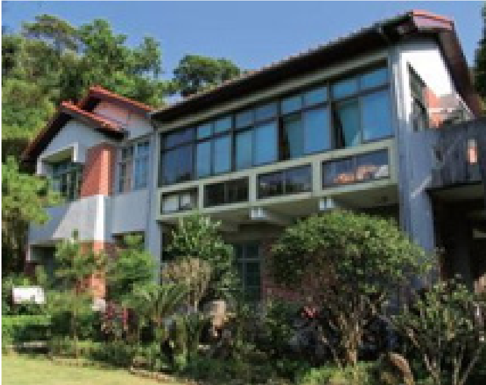
Su Shu House

és esszenciális kulturális megértése, szűk látókörök jövőjét vetíti előre. A kínai kulturális klasszikusokat nem lehet egyszerűen tudományos gyakorlatként olvasni, hanem mind inkább azt kell megérteni, tartalmuk hogyan integrálható az emberek életébe, hogy juttatható el a világon mindenhova az emberek szívébe és tudatába. Másként a tartalma mindössze poros könyvek lapjaira nyomtatott idejétmúlt szavakként marad csak jelen.