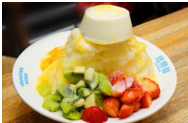
Yongkang Street Mango Shaved Ice: kötelező az ételrajongók számára

A Yongkang utca 15-ös szám előtt még akkor is vendégek hosszú sora várakozik, ha fúj a szél, esik az eső, vagy rettenetesen hideg van. Az üzlet megtelik, az emberek pedig izgatottan várják, hogy kipróbálhassák a hatalmas tál mangós shaved ice-t. Korábban ez volt a híres Yongkang 15 shaved ice üzlet helyszíne, ma azonban a „Smoothie house”-