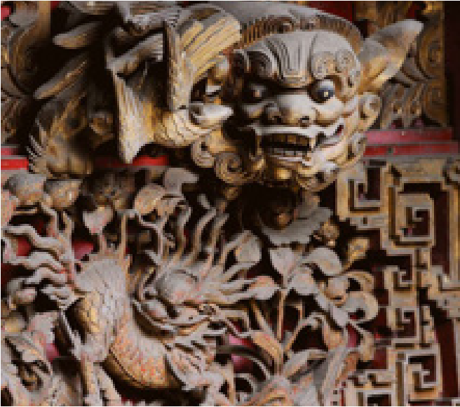
Fafaragások New Taipei City Sanxia kerületének Sanxia Qingshui Zushi templomában

Egy régi kínai hagyomány úgy tartja, hogy egy istenség a hívó őseinek otthonából adhatja a legnagyobb áldást. Így évszázadokkal ezelőtt, amikor a szárazföldi Kínából érkezett bevándorlók megkezdték otthonaik építését Tajvan ismeretlen földjén, sokszor magukkal hozták azon istenségek szobrai, melyeket közösségeikben dicsőítettek.