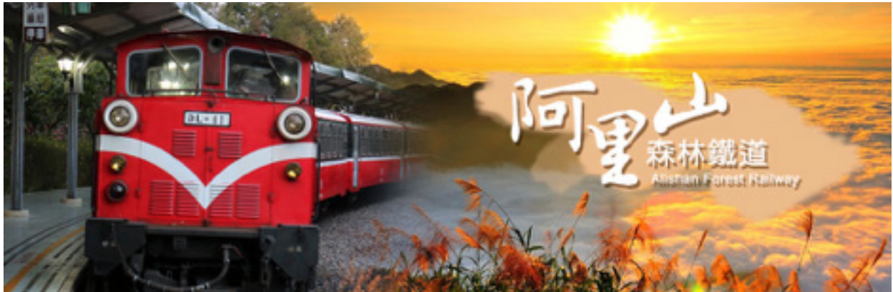
A TRA, Alishan Erdei Vasúti részlegének tulajdona

Szeptember 27-én, Dél-Tajvan Chiayi városában megkötötte az együttműködést megalapozó egyezményt az Alishan Erdei Vasút, valamint a Welshpool és Llanfair Könnyű Vasútmegőrzési Társaság (WLR).