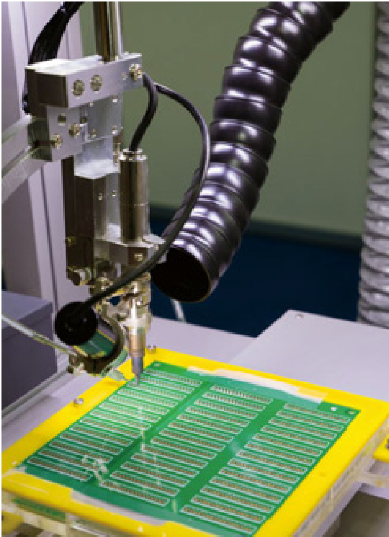
A gépezeti gyártók a Taichung csoportosulásban magas sebességű és precíziós készülékeket gyártanak, melyeket világszerte használnak. (Chin Hung-hao)