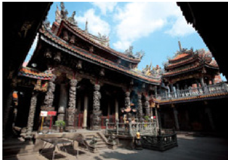
A Sanxia Qingshui Zushi templomot 1767-ben építették.

Gyakorlatilag Tajvan összes régi temploma számos felújításon ment már keresztül, olyan dolgoknak köszönhetően, mint a páras éghajlat, vagy a természeti katasztrófák gyakorisága. Számos generáció fogadott fel mestereket a felújítási munkákra, akik mind hozzátették saját dekoratív elemeiket. Ez a eklektikus megközelítés alakította Tajvan templomait a hagyományos építészet és kézművesség lenyűgöző, élő múzeumaivá.