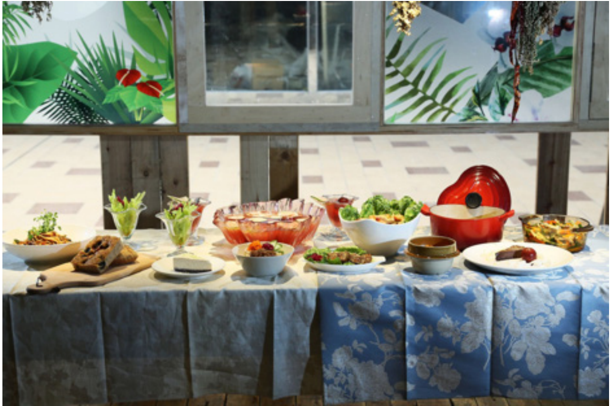
Egy 2017 áprilisi jelentésben a CNN Tajpejt ismét a világ 10 legnépszerűbb városaként jelölte a vegán fogásokat tekintve.

sok más. Dél-Afrikában az ember nem talál ekkora változatosságot,” mondja. A gyümölcsökből és zöldségekből bőségesen válogathat egész évben, bár bizonyos fajták elérhetősége szezonfüggő. Tajvan valóban különleges környezettel van megáldva.